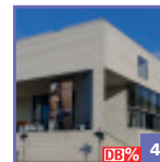
MUSEUM GEORG SCHÄFER

beon communications 7. Auflage design by 3WM.de