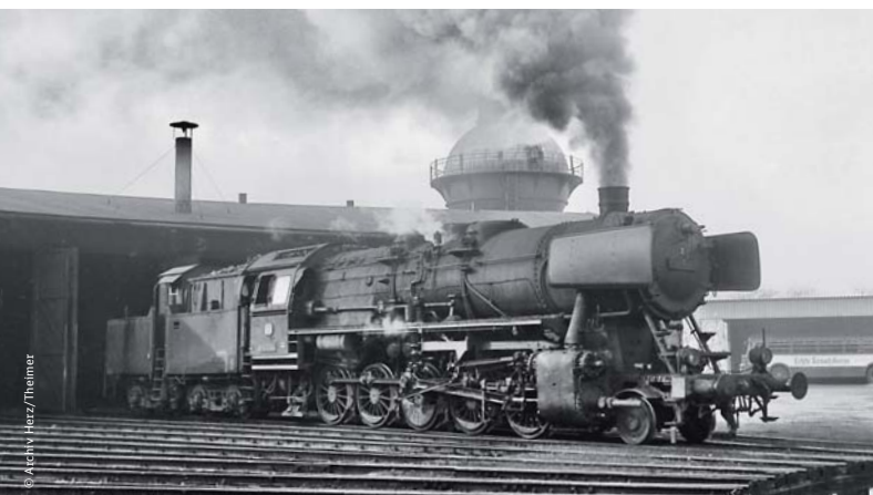
Die Lok 50 1045 wartet auf den nächsten Einsatz (1966).

Goslar. Obwohl auch ab 1866 der Eisenbahnbetrieb zwischen Vienenburg und Goslar aufgenommen wurde, war Goslar vorerst nur ein unbedeutender Endpunkt im schnell wachsenden Streckennetz der damaligen Zeit. Erst als 1883 zeitgleich die neuen Strecken von Goslar nach Grauhof und Langelsheim eröffnet wurden und der Goslarer Bahnhof damit Durchgangsverkehr bekam, wuchs auch schnell seine betriebliche Bedeutung.