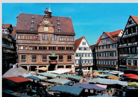
Markttag in der Tübinger Altstadt

Bootsvermietung Märkle, Eberhardsbrücke 1, Tel. 0 70 71 / 3 15 29